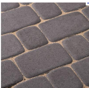
Chodník šírky 1,8 m a 1,2 m – NOSTALIT – hr.6 mm – grafit Obrázok č.1