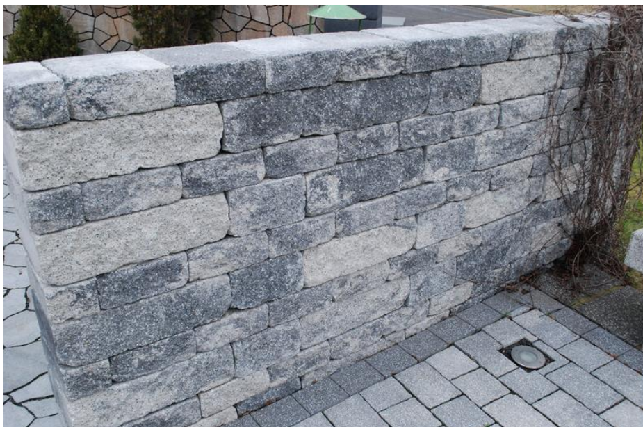
Oporné múriky – BOSS ANTIK (murovaná stena), hr.250 mm