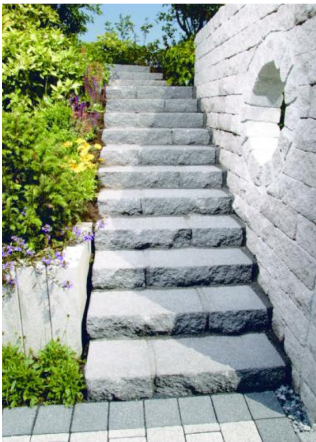
Schody – BOSS ANTIK – šírka nástupnice hr.400 mm (alt.2 NATURANA FLAIR-blokový schod šírka nástupnice 350 mm a výška stupňa 150 mm) – farba sivá alt. grafitová